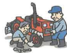
農機具修理・点検・車検費