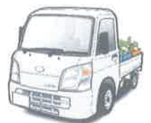
軽トラック購入費用

※融資商品の詳しい内容については、裏面に記載している商品概要説明書を必ずご確認ください。 ※本商品をご利用中に、繰上返済を行う場合や返済条件を変更する場合には別途当JA所定の手数料をご負担いただきます。 ※審査の結果、融資のご希望に添えない場合もありますのでご了承下さい。