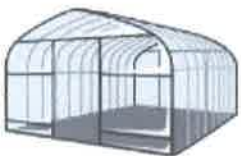
パイプハウス建設費用