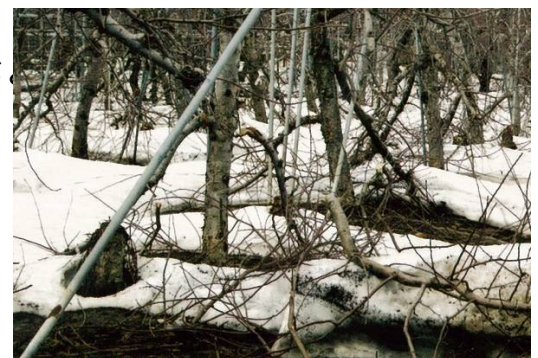
沈降力によるりんごの枝折れ