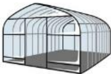
パイプハウス建設費用