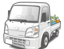
軽トラック購入費用

※融資商品の詳しい内容については、裏面に記載している商品概要説明書を必ずご確認ください。 ※本商品をご利用中に、繰上返済を行う場合や返済条件を変更する場合には別途当JA所定の手数料をご負担いただきます。 ※審査の結果、融資のご希望に添えない場合もありますのでご了承下さい。