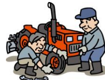
農機具修理・点検・車検費