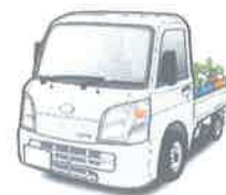
軽トラック購入費用

※融資商品の詳しい内容については、裏面に記載している商品概要説明書を必ずご確認ください。 ※本商品をご利用中に、繰上返済を行う場合や返済条件を変更する場合には別途当JA所定の手数料をご負担いただきます。 ※審査の結果、融資のご希望に添えない場合もありますのでご了承下さい。