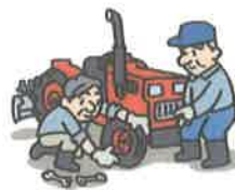
農機具修理・点検・車検費