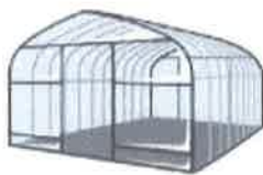
パイプハウス建設費用