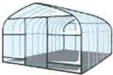
パイプハウス建設費用