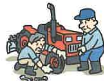
農機具修理・点検・車検費