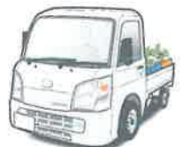
軽トラック購入費用

※融資商品の詳しい内容については、裏面に記載している商品概要説明書を必ずご確認下さい。 ※本商品をご利用中に、繰上返済を行う場合や返済条件を変更する場合には別途当JA所定の手数料をご負担いただきます。 ※審査の結果、融資のご希望に添えない場合もありますのでご了承下さい。