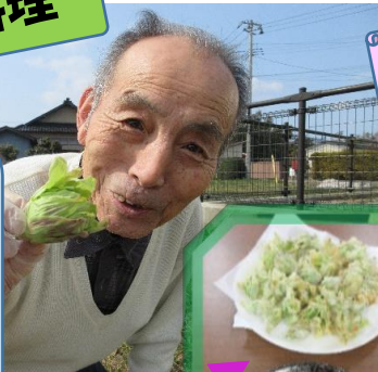
天ぷら ばんけ味噌

3月に入り、道端に ちらほらとふきのとうが出 てきました。採りに行って、 とれたてをその場で料理し、 春の訪れを感じながら皆様 でいただきました！いやー、 おいしかったですね！