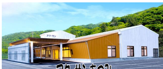
アク・サンあつみ