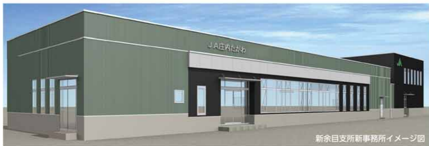
新余目支所新事務所イメージ図