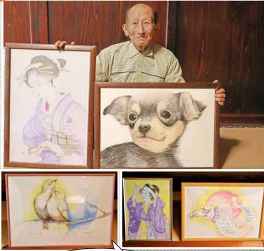
愛情を込めた自慢の作品です!

私にとって絵は人生の華です。今よりさらに上手に描けるように日々学び、知識を深めていきたいです。