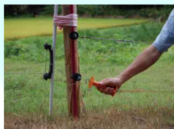
侵入防止柵の設置